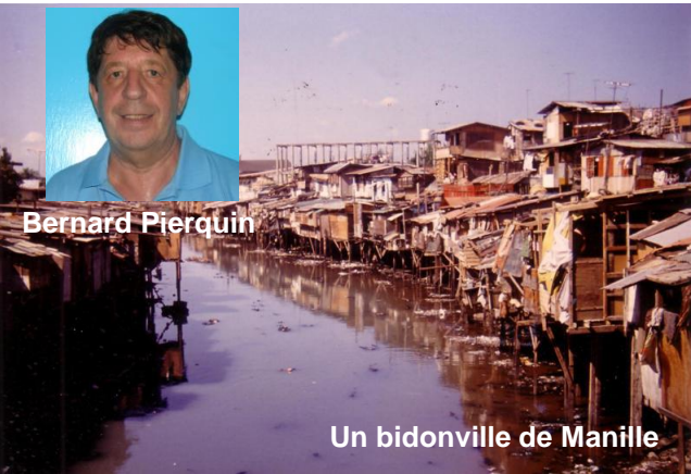
Un bidonville de Manille