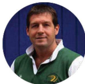
Alain Rolland ancien joueur du XV d'Irlande et ancien arbitre international