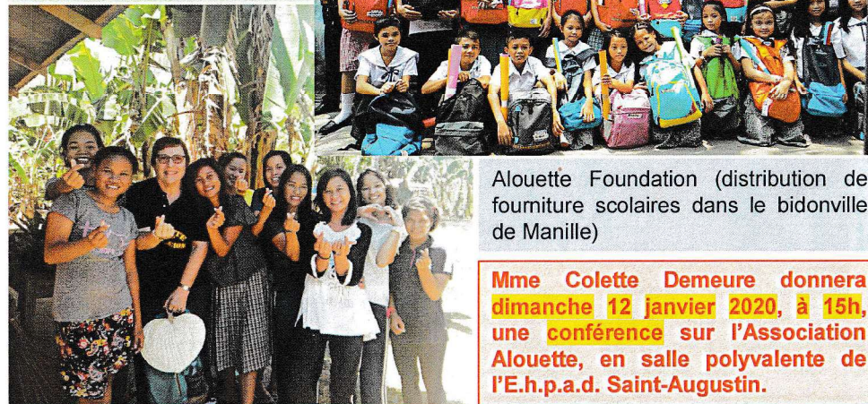
Alouette Foundation (distribution de fourniture scolaires dans le bidonville de Manille)