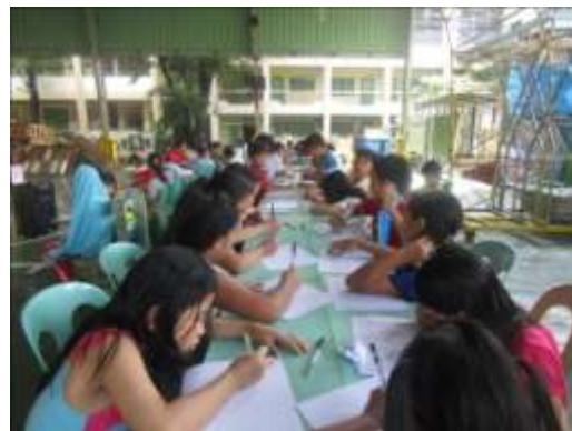
Formation dynamique de groupe / compétences de vie pour les parents et les élèves